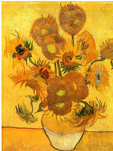
Ван Гог, Подсолнухи

Картина в теплых оттенках передает радость. Ван Гог в письмах к своему брату писал, как много у него вдохновения, и как хорошо он чувствует себя, в момент написания этой картины