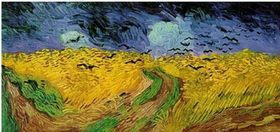
Ван Гог, Именитое поле

Из-за активных мазков и холодного колорита картина имеет мрачное настроение, передает тревогу и душевные терзания художника